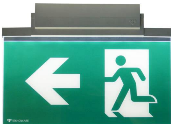
Markeringslys i henhold til NS-EN-1838