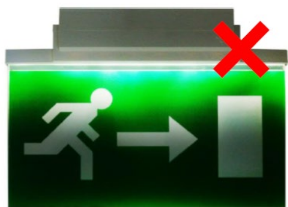
Markeringslys ikke i henhold til NS-EN-1838